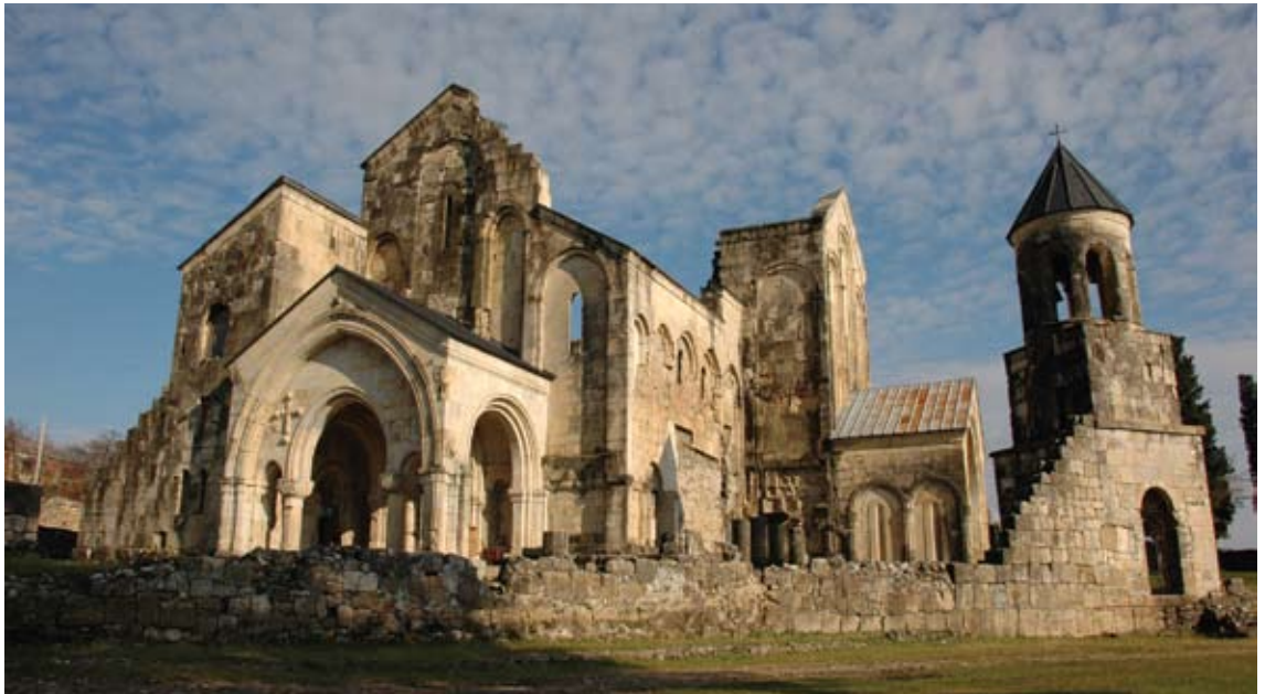
ქუთაისი. ბაგრატის ტაძარი XI ს. დასაწყისი