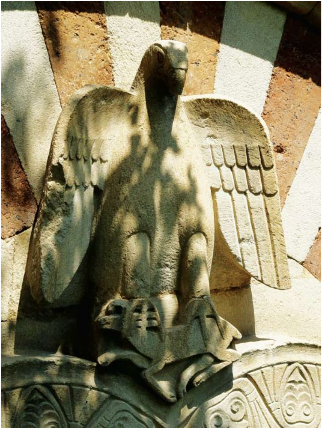
ხაზული არწივის ჰორელიეფური გამოსახულება ხაზულის ტაძრის სარკმელთა შორის. X ს.