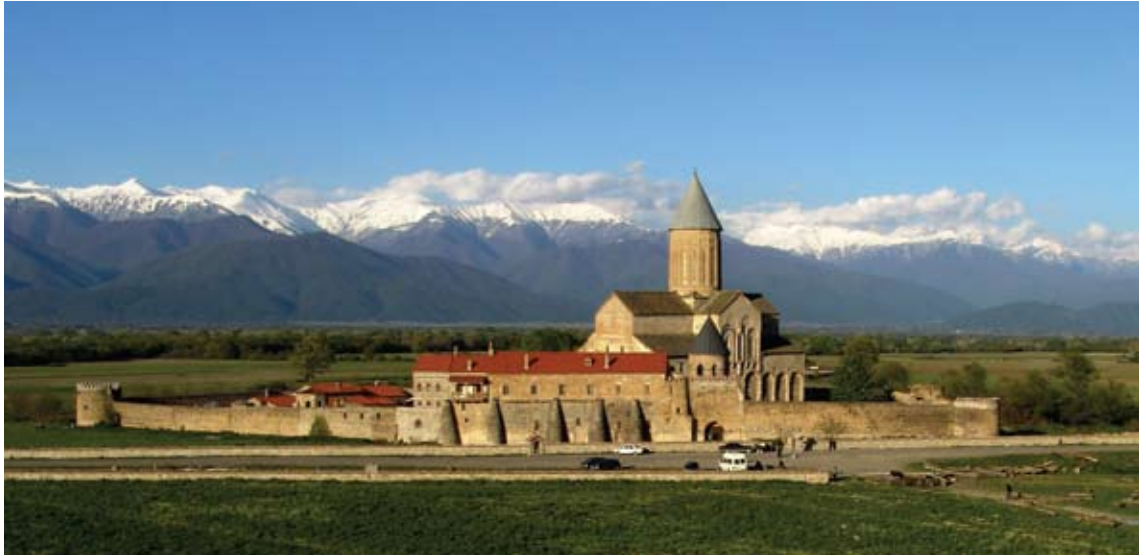
ალავერდი საკათედრო ტაძარი. XI ს. დასაწყისი