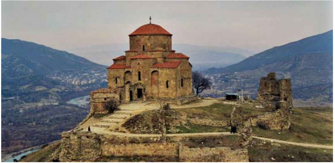
მცხეთა წმ. ჯვრის ტაძარი. 586-604 წ.წ.