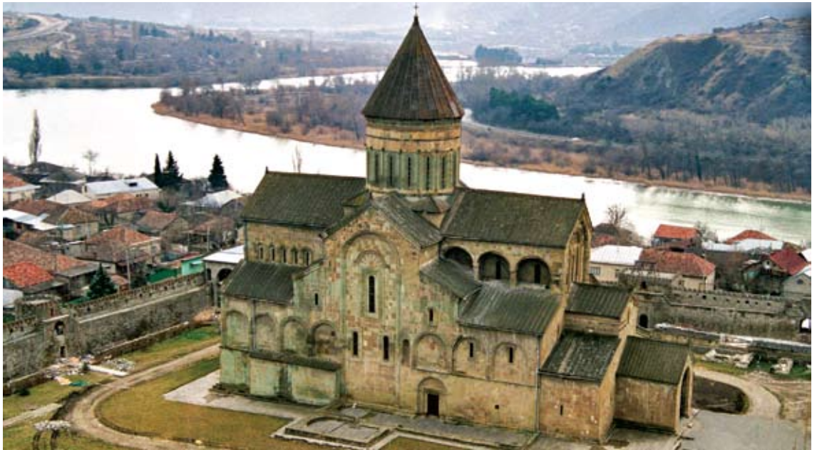
მცხეთა სვეტიცხოვლის საპატრიარქო ტაძარი. 1110-1029 წ.წ.