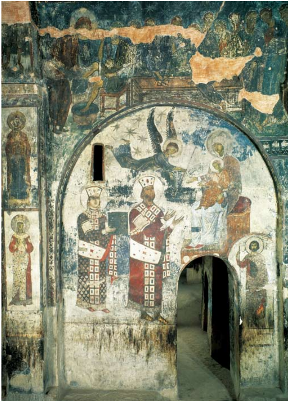
ვარძია. ღვთისმშობლის მიძინების ტაძარი. ჩრდილოეთი კედელი თამარ მეფე და გიორგი III. 1144-1186 წ.წ.