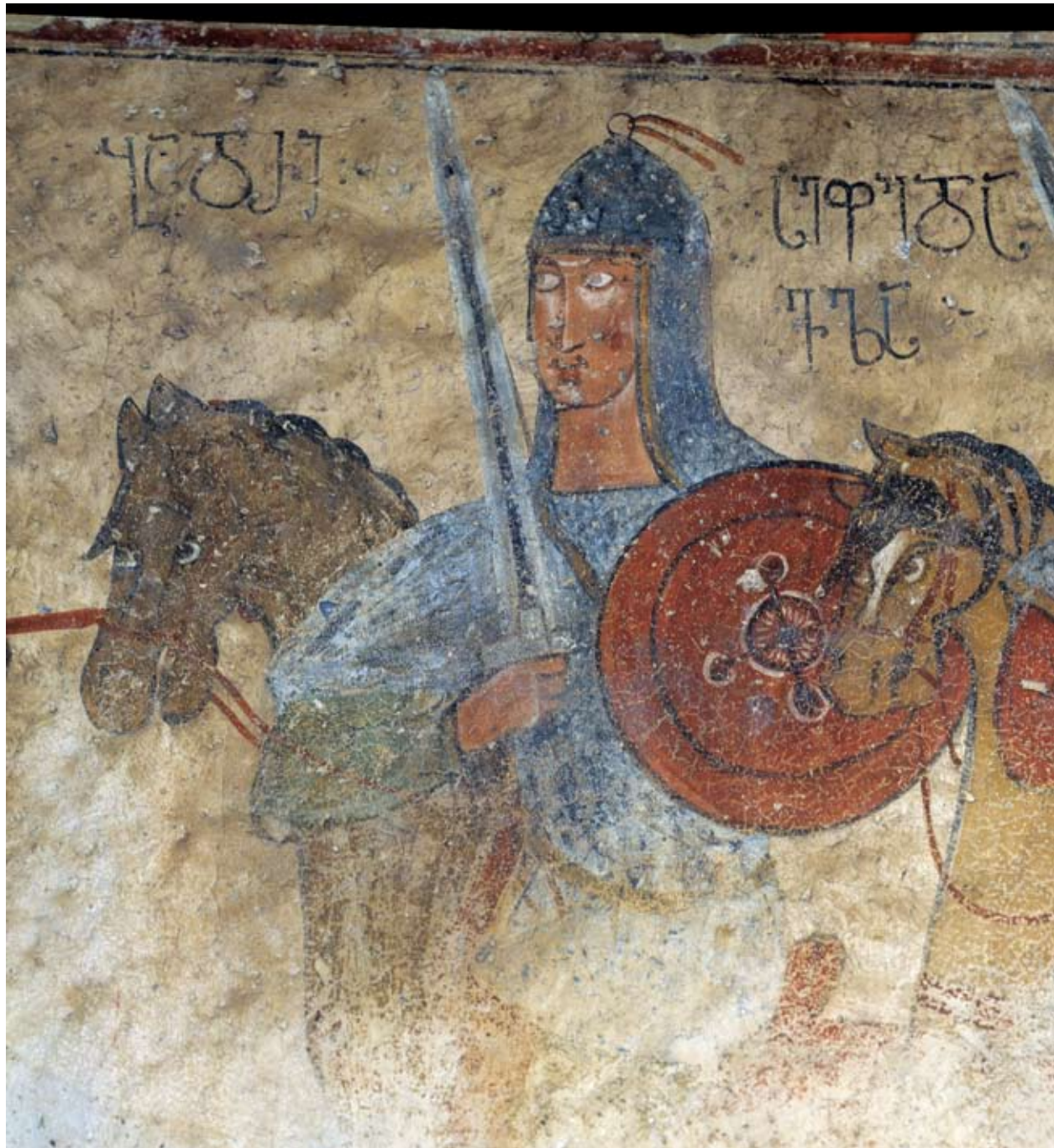
ლენჯერი (ლაშთხვერი). სცენა ხალხური ეპოსისა „ამირანდარეჯანიანი“ ფრაგმენტი. მეომრები. XIV-XV ს.ს.