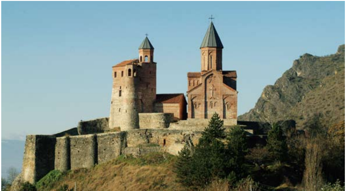
გრემი საერთო ხედი. XVI ს.