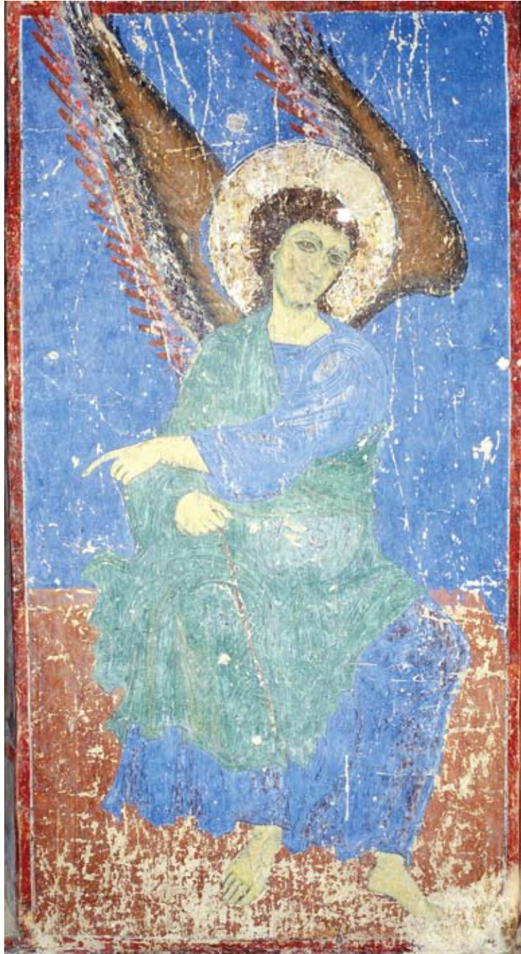
ანგელოზი აღდგომის სცენიდან ყინწვისის წმ. ნიკოლოზის ტაძრის მოხატულობა. XII-XIII ს.ს.