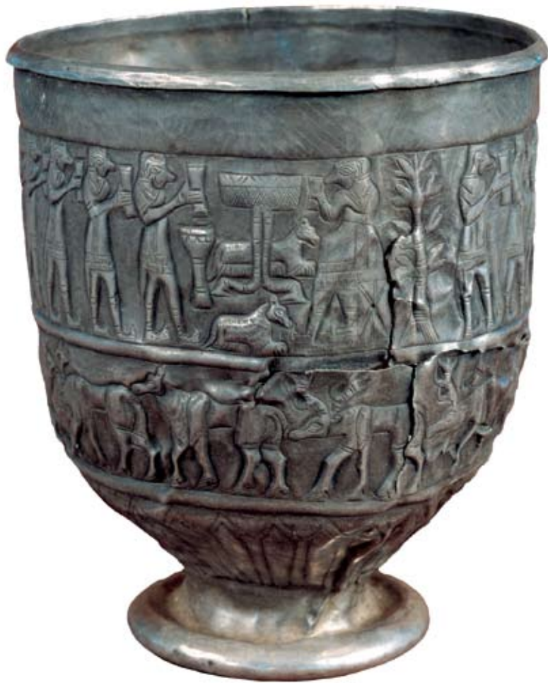
ფრიზებიანი თასი. თრიალეთი ძვ. წ. აღ-ის II ათასწლეულის შუა ხანა.