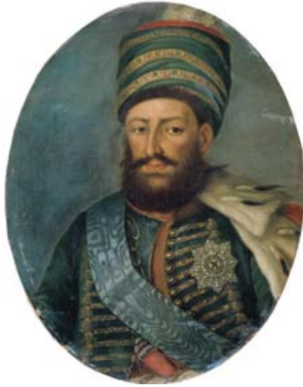
მუჟე ერეკლე II XVIII ს.