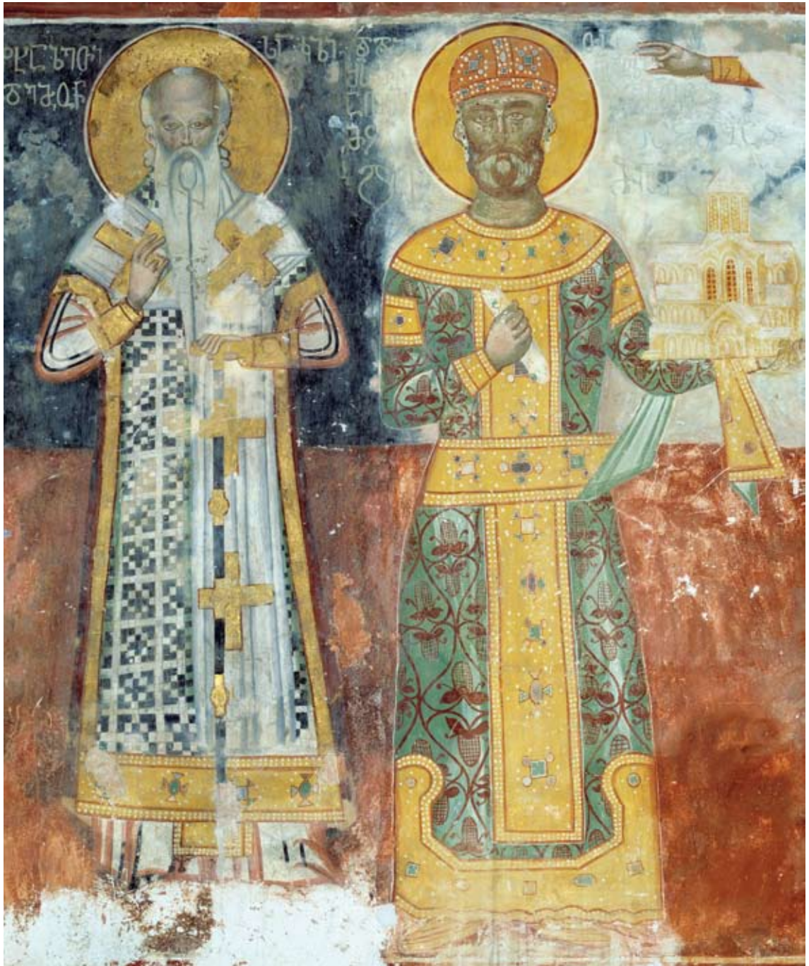
გელათის მონასტერი. ღვთისმშობლის მთავარი ტაძარი. ჩრდილოეთი კედელი კათოლიკოსი ევდემონ ჩხეტიძე და დავით IV აღმაშენებელი. XVI ს.